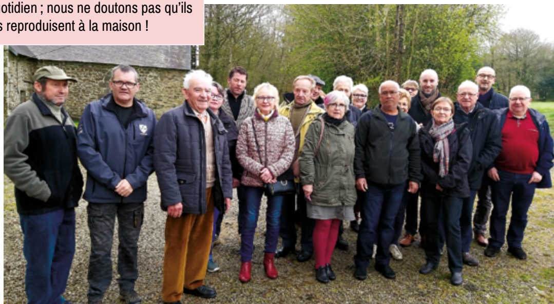
Réunion de quartier à Illijour

À la cantine, les enfants sont amenés à trier leurs déchets. Ces gestes font désormais partie de leur quotidien ; nous ne doutons pas qu'ils les reproduisent à la maison !