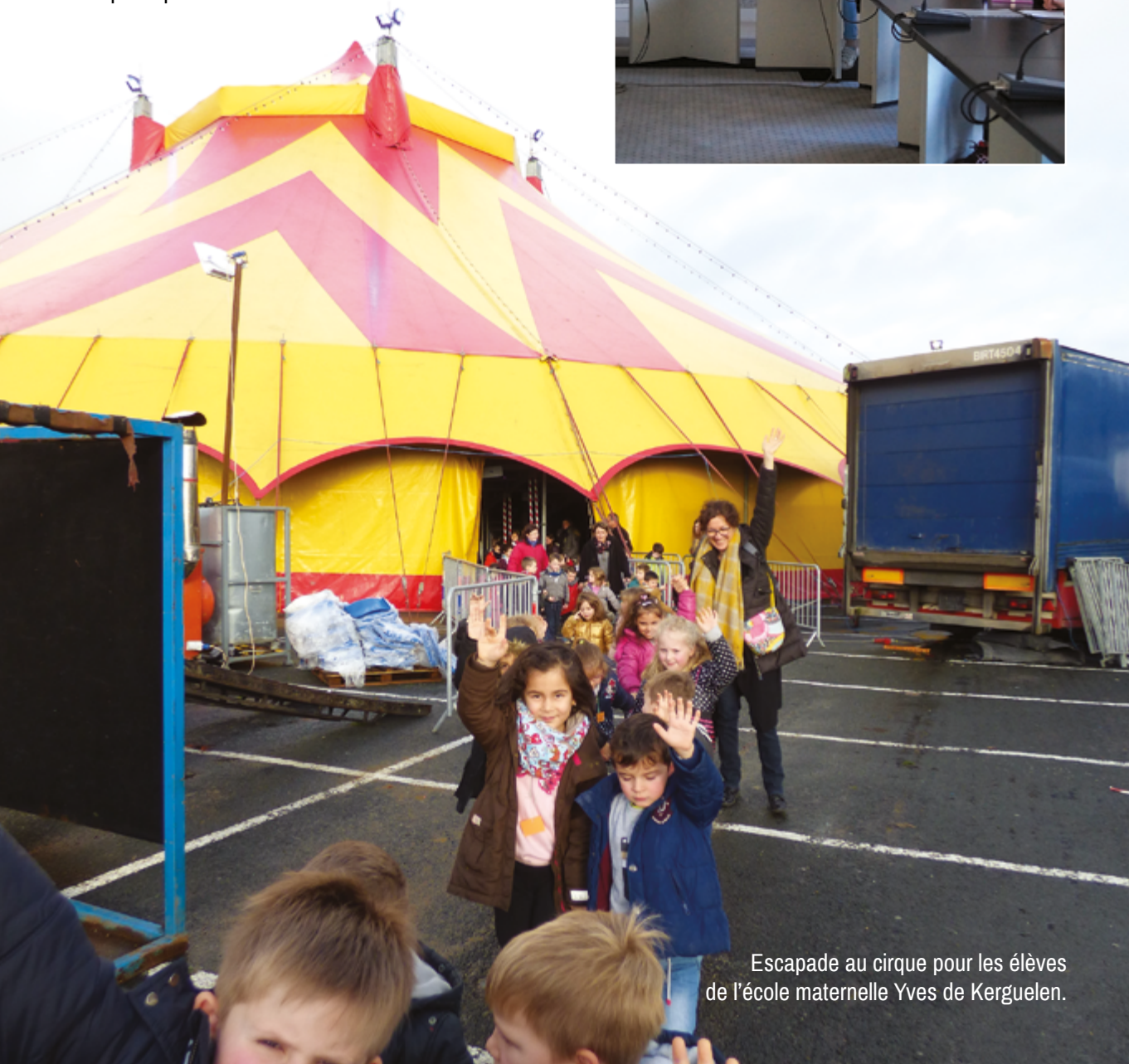
Escapade au cirque pour les élèves de l'école maternelle Yves de Kerguelen.