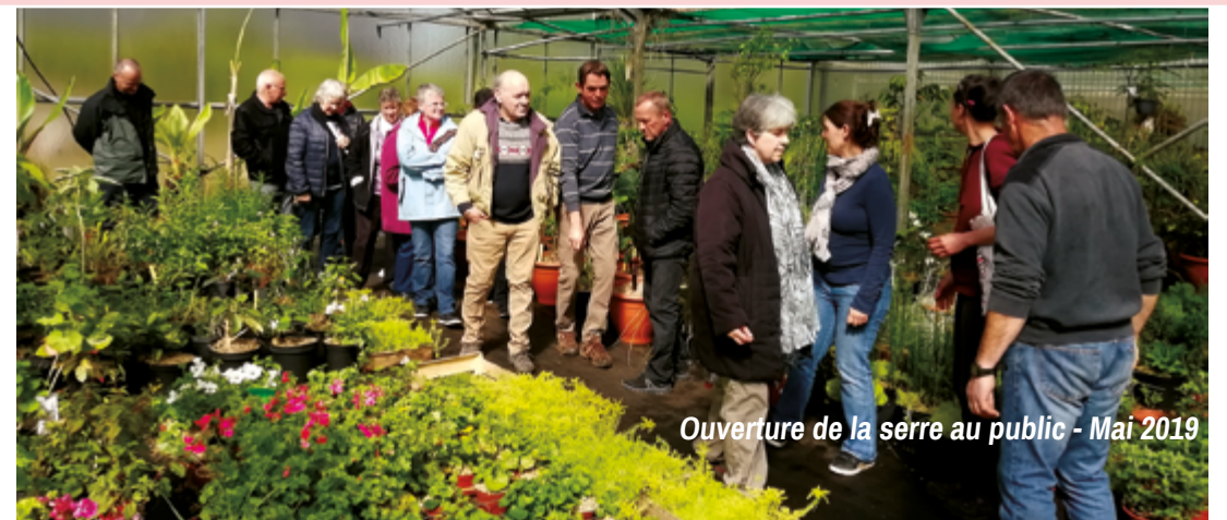
Ouverture de la serre au public - Mai 2019

La réglementation du « zéro phyto » s'est aujourd'hui étendue aux particuliers. Afin de vous accompagner dans cette démarche, la municipalité vous a proposé en avril dernier, une matinée d'échanges avec les Espaces Verts à la serre municipale. Les agents vous ont partagé leurs pratiques d'entretien et de fleurissement et prodigué astuces et conseils à reproduire chez vous.