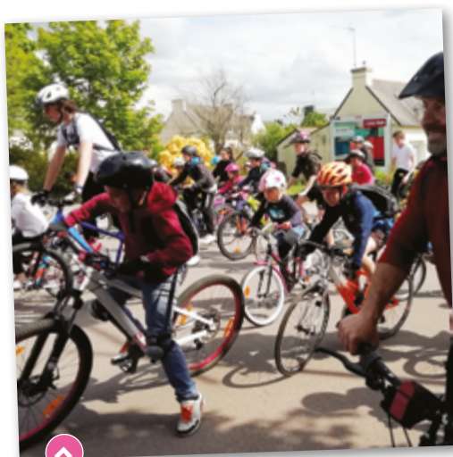
En vélo, en rollers ou à trottinette, l'événement « Ça roule à Briec » a attiré plus de 200 participants.